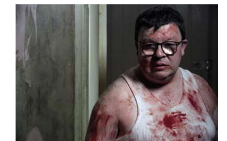
„Mum and Dad“ („Ema ja isa“, Inglismaa 2008, režissöör: Steven Sheil)