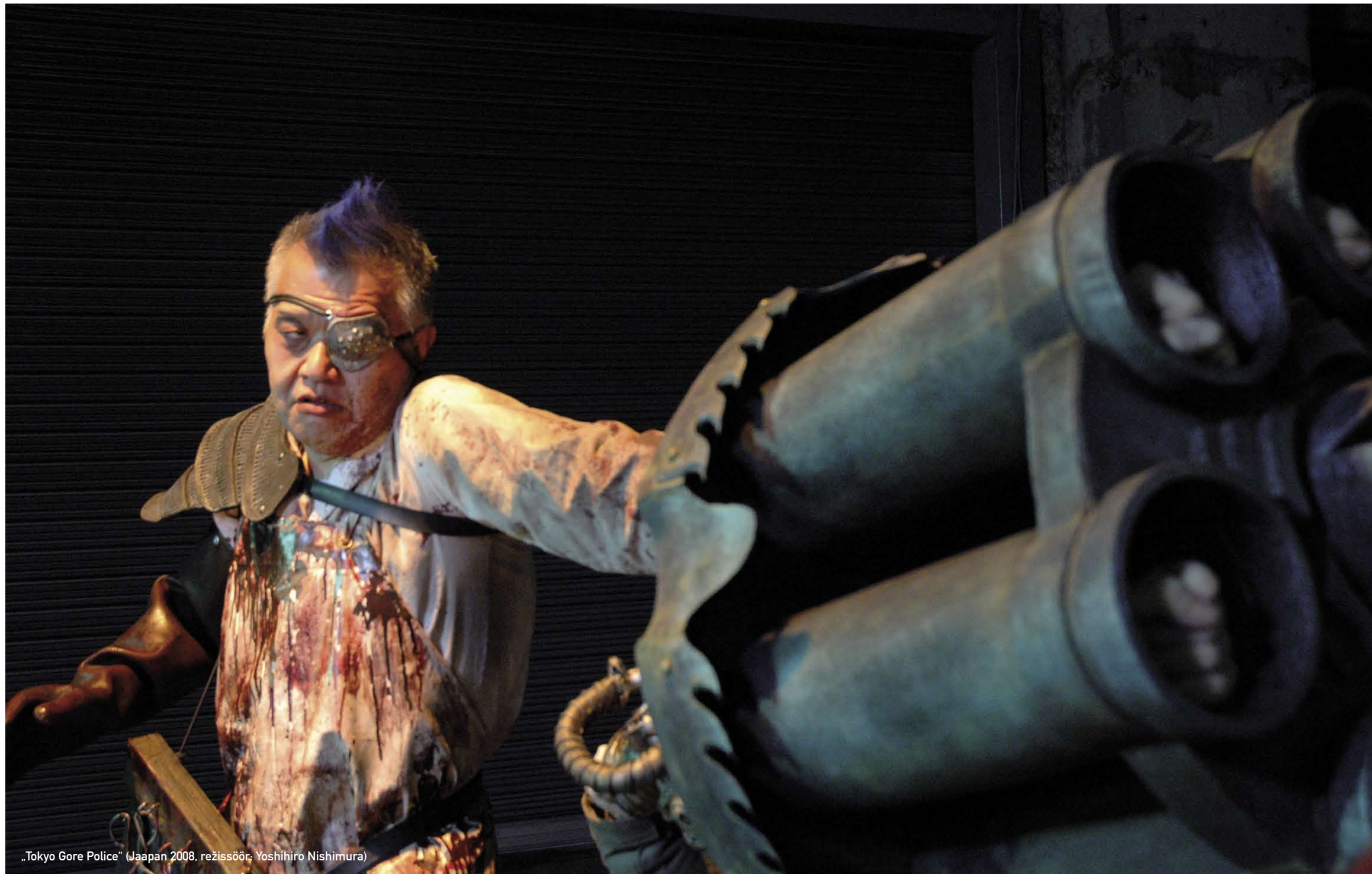
„Tokyo Gore Police“ (Jaapan 2008, režissöör: Yoshihiro Nishimura)

Festivali uute filmide programmis on filme tänavu Brasiiliast, Inglismaalt,