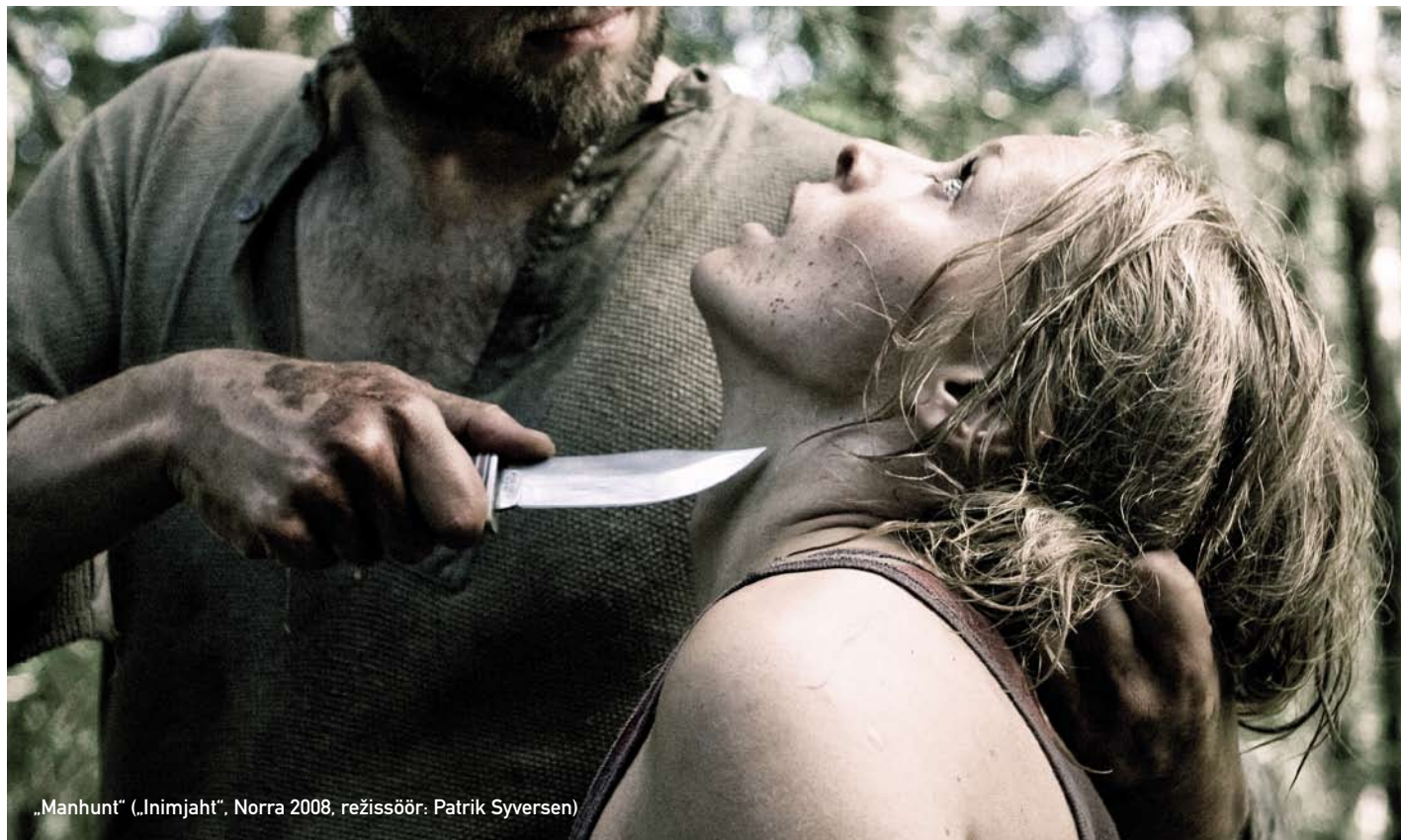
„Manhunt“ („Inimjaht“, Norra 2008, režissöör: Patrik Syversen)

HÖFF saab teoks Haapsalu linna, Haapsalu kultuurikeskuse ning Tallinna Pimedate Ööde Filmifestivali ühispingutusena. Üksikseansi pilet maksab 50 krooni, kõiki festivali filme vaadata võimaldav pass 300 krooni. Täpsemat informatsiooni HÖFF 2009 kohta leiab festivali koduleheküljelt www.hoff.ee ■