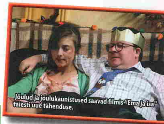
Jõulud ja jõulukaunistused saavad filmis "Ema ja isa" täiesti uue tähenduse.